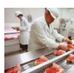
Proceso de Alimentos