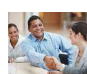
Oficina y Ambientes