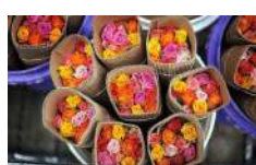
Distribución de Flores