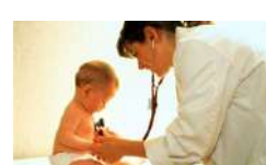
Salud y Laboratorio